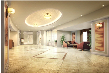
「グッドタイム リビング 宝塚逆瀬川」エントランスホール パース