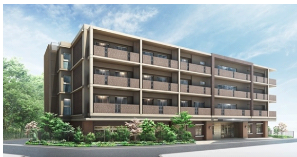
「グッドタイム リビング 宝塚逆瀬川」外観パース

オリックス・リビング株式会社(本社:東京都港区、社長:森川 悦明、以下「オリックス・リビング」)は、シリーズ 28 棟目となる有料老人ホーム『グッドタイム リビング 宝塚逆瀬川』を 2017 年 4 月にオープンいたします。オリックス・リビングでは、兵庫県での有料老人ホームの開設は 7 年ぶりとなり、宝塚市では初めての開設となります。これにより、オリックス・リビングの運営する有料老人ホーム「グッドタイムリビング」は、合計 28 棟、2,326 室となります。