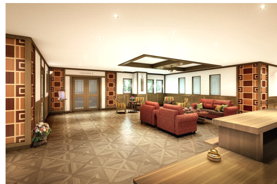
グッドタイム リビング 嵯峨有栖川 エントランスホール