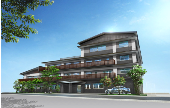
グッドタイム リビング 嵯峨広沢