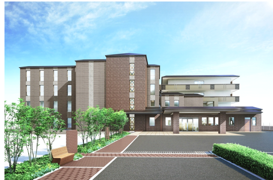
グッドタイム リビング 嵯峨有栖川