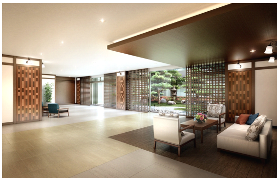
グッドタイム リビング 嵯峨広沢 エントランスホール