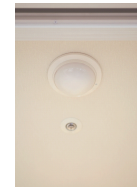
生活サイクルセンサー

在宅時、センサーが人の動きを一定時間検知しない場合、 緊急事態とみなし館内スタッフがお部屋に伺います。