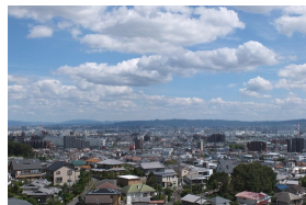
「グッドタイム リビング 千里ひなたが丘」 からの眺望:平成26年9月撮影