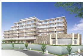
「グッドタイム リビング 千里ひなたが丘」 外観パース

大阪市外を一望できる開放的な眺望とともに、お食事を味わう優雅なひとときをご堪能いただけます。