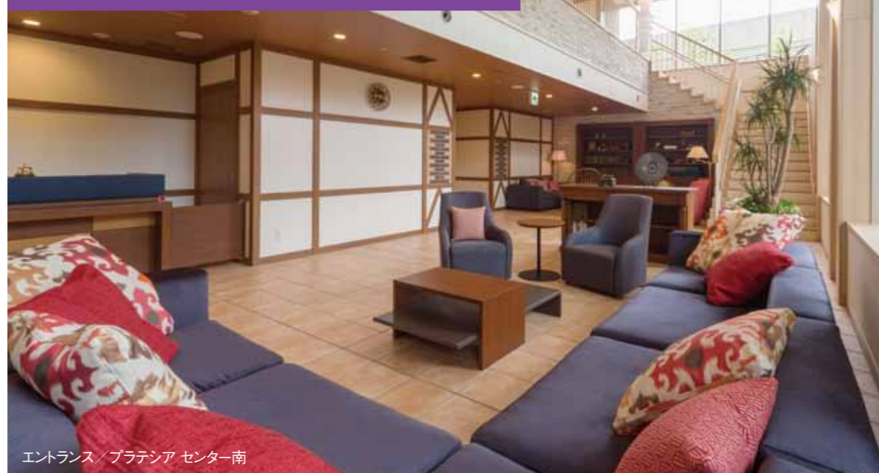
エントランス/プラテシアセンター南