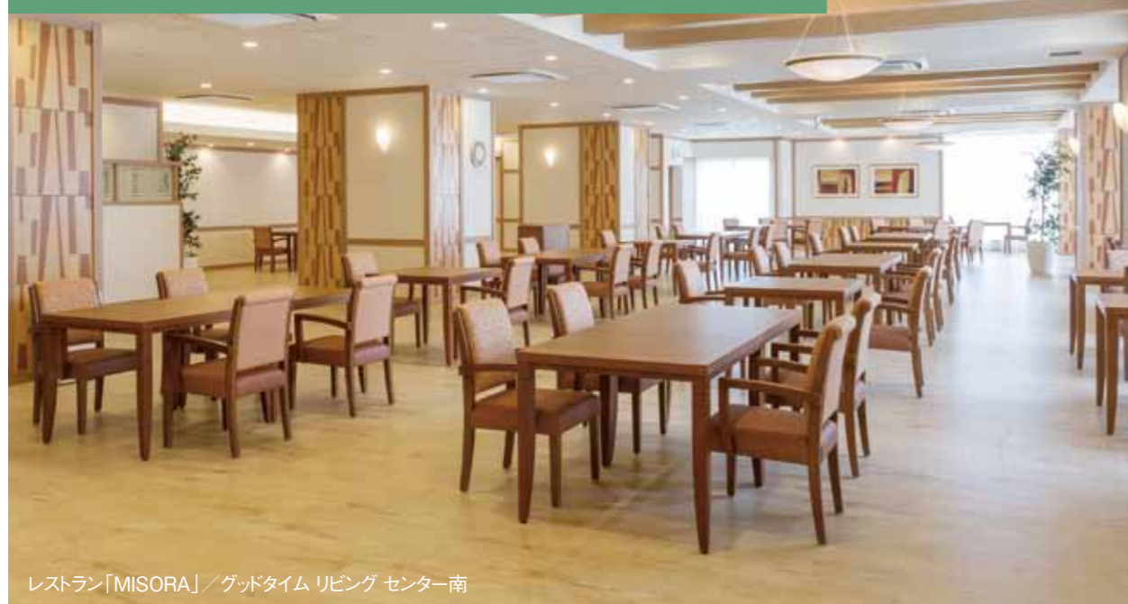
レストラン「MISORA」/グッドタイムリビングセンター南